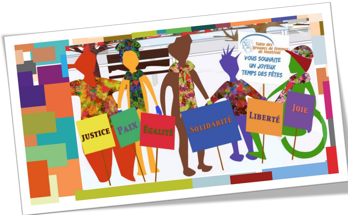
Table des groupes de femmes de Montréal

110, rue Sainte-Thérèse, bureau 505 Montréal (Québec), H2Y 1E6